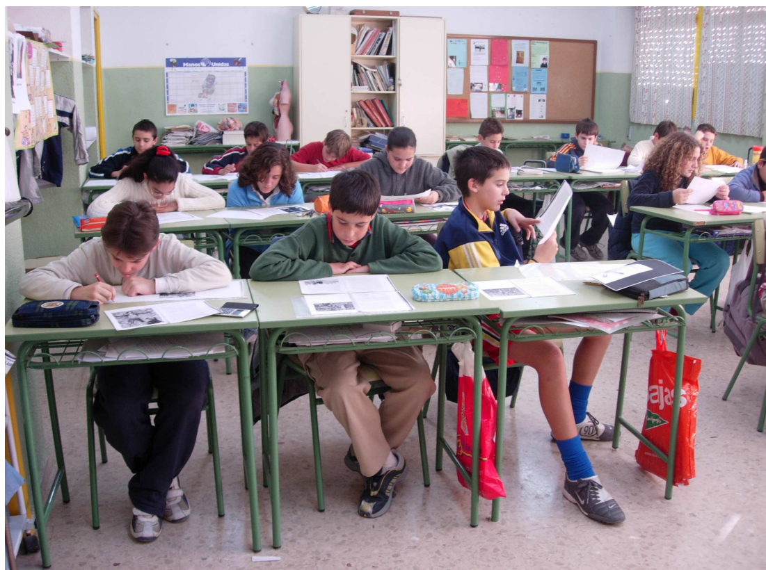
Alumnos de Tercer Ciclo de Educación Primaria del Colegio Público “Federico de Arce” realizan actividades de ceración literaria en homenaje al Quijote .