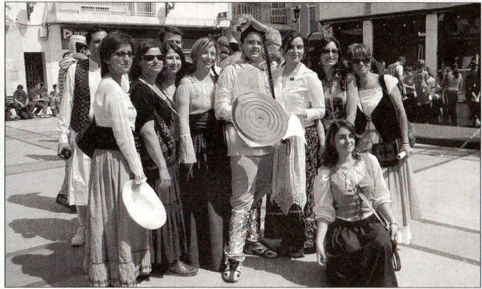
Los alumnos y profesores se disfrazaron de típicos personajes de la época de Don Quijote y llenaron la Plaza con aires medievales. (Angela Fleckenstein)

Los actos conmemorativos del Día del Libro comenzaron el pasado 17 de abril en la Explanada de Lo Pagón con actividades realizadas por la biblioteca local. Durante toda la mañana, los niños pinaterenses pudieron disfrutar de un amplio