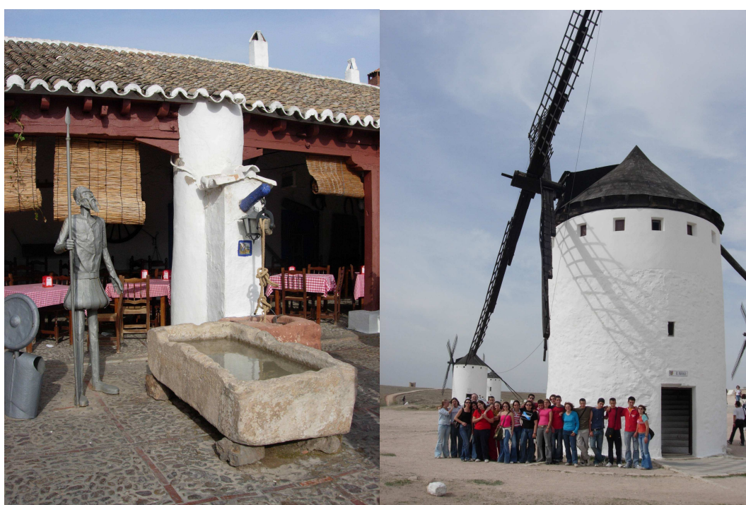
Casa de Cervantes (Alcalá de Henares) - Cárcel de Argamasilla de Alba - Cueva de Montesinos (Lagunas de Ruidera) – La venta de Puerto Lápice – Molinos (Campo de Criptana).