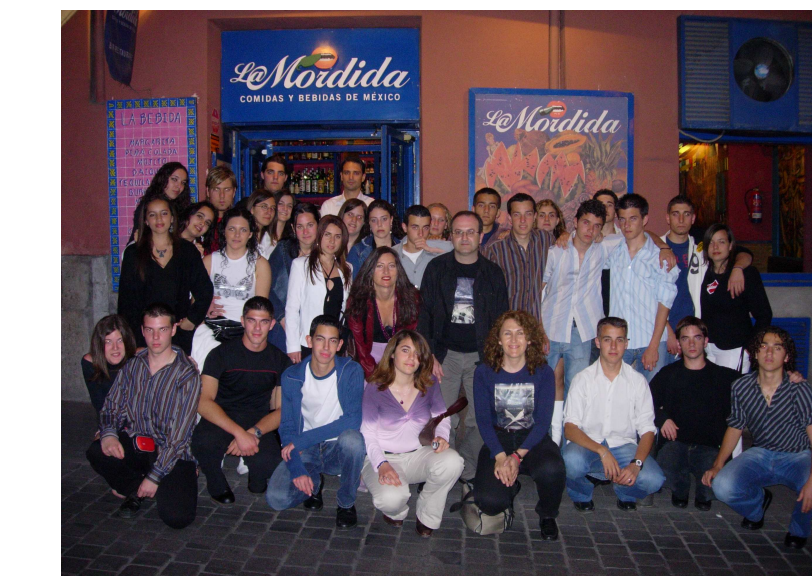
Puerto Lápice (Ciudad Real)