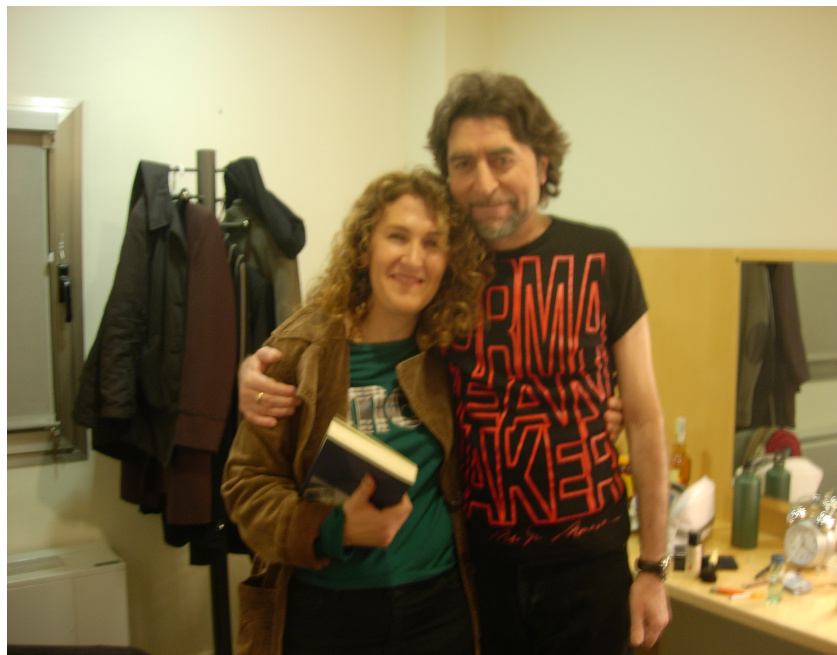
Auditorio de Murcia. Enero de 2006