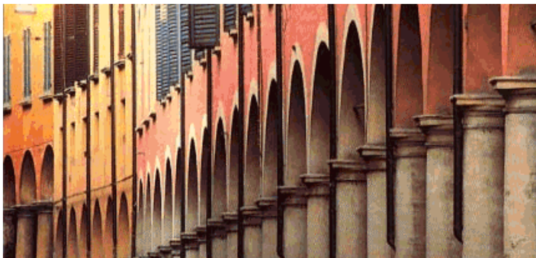
Fig. 1.34. Porxos de Bologna, un dels trets més característics de la ciutat. És ampliament conegut que es pot fer un recorregut de quilòmetres sense sortir mai de sota els porxos

Les ciutats mostren el seu caràcter 1 en els espais intermedis que ofereixen als visitants, tant si són d'ús privat dels habitants, com si són espais d'ús lliure per als habitants i, per tant, propis de la ciutat.