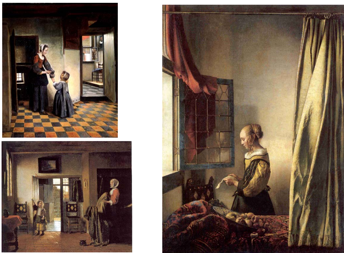
Fig. 1.26. La pintura flamenca ofereix un ampli repertori d'espais domèstics, representa la vida del moment

La separació més important entre la vida familiar i la feina es fa cap al Renaixement, ja que fins llavors aquestes dues accions tenien lloc al mateix edifici. Els edificis tenen un altre caire, i no sols això: aquest canvi afecta totes les estructures socials. L'arquitectura comença a especialitzar-se i es pot dir que apareixen els primers edificis públics, —diferents dels representatius, que ja existien abans. L'ús, l'horari d'ocupació, el funcionament, el programa, etc. són molt diferents dels que existien fins al moment.