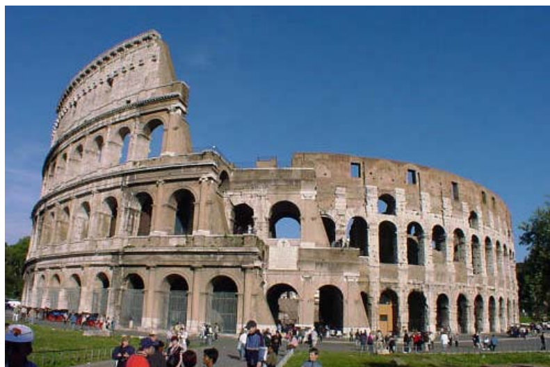
Fig. 1.28. Les construccions públiques, gregues o romanes, tenen una presència important a la imatge de la comunitat

Aquestes construccions tenen programes nous, dimensions no habituals i moltes vegades han de desenvolupar sistemes constructius nous. Moltes vegades, prenen els espais intermedis existents a l'arquitectura domèstica i els incorporen al seu repertori. El porxo domèstic es transforma en la stoá ; el vestíbul, en el propileu, o el mirador, en el minaret.