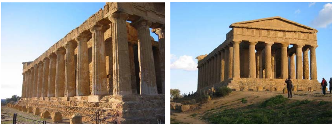
Fig. 1.30. Temple d'Agrigento, Sicília.

A la Grècia antiga es pot afirmar que coexistien els tres tipus d'arquitectures: l'habitatge privat amb pati , de clara influència oriental; els espais públics per a l'ús dels ciutadans, com és el teatre o l'àgora (amb la stoà , un porxo, al capdavant), i els magnífics temples en representació de les divinitats de l'Olimp, tots, espais intermedis, a excepció de la cel·la interior.