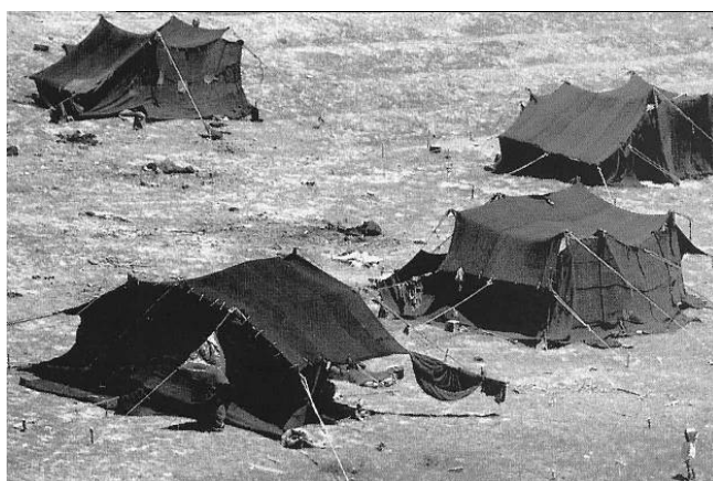
Fig. 1.24. Tenda del desert amb tendal a l'entrada, a manera de vestíbul

Però fins i tot en aquests habitatges mòbils, a vegades s'incorporen ja algun tipus d'espai que podríem qualificar d'espai intermedi. Això seria el cas dels pavellons tesats o els paravents de tela que es col·loquen al voltant de les tendes de les tribus nòmades del desert. Compleixen la funció de protecció contra la sorra del desert, però alhora fan com d'una mena de vestíbul, que, segons el cas, es pot qualificar de vestíbul domèstic o es pot considerar representatiu.