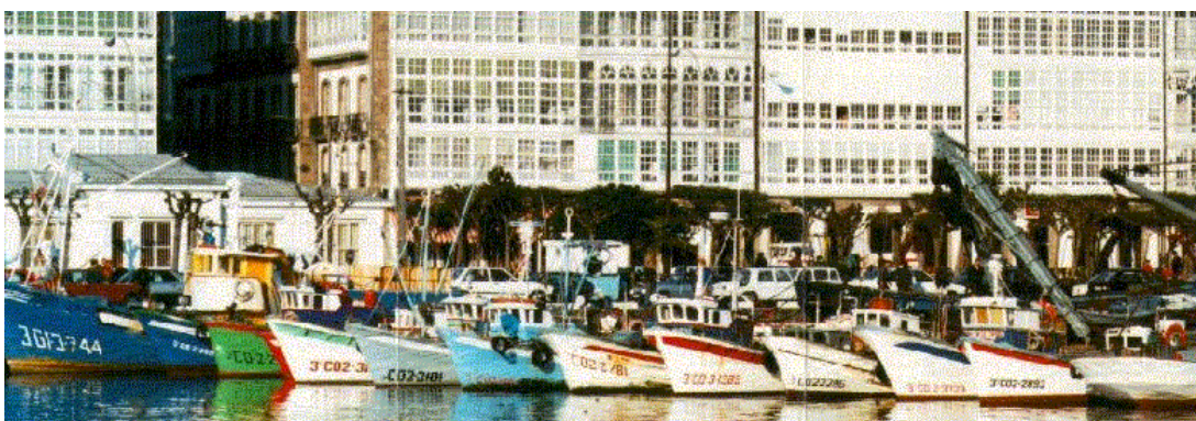
Fig. 1.35. Avinguda de la Marina, La Corunya

Un exemple del primer cas poden ser les galeries vidrades d'habitatges, com és el cas de La Corunya, que a pesar de ser privades donen un caire especial a la ciutat. Les porxades de Santiago de Compostel·la o de Bologna representarien el cas contrari: pòrtics urbans que també són els que donen a aquestes ciutats una personalitat.