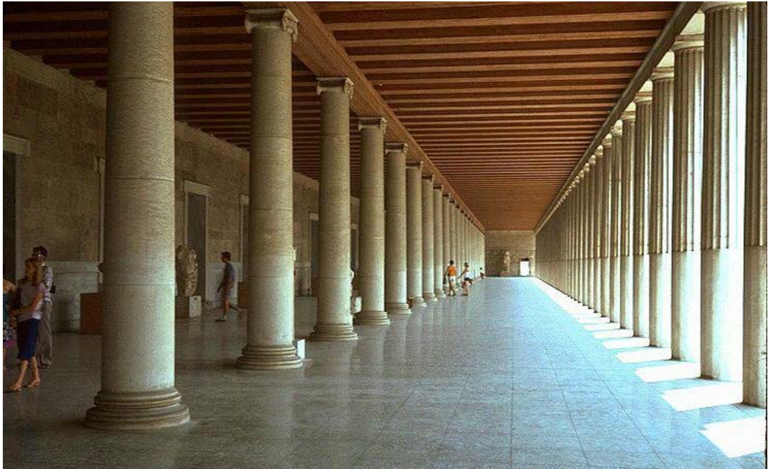
Fig. 1.29. Estoa d'Atalos (Atenes) és una transposició a escala pública dels peristils domèstics, però dóna una imatge comunitària a la polis i és generadora del projecte urbà

L'arquitectura pública, fins i tot, pot fer servir espais intermedis com a elements generadors del projecte, ja que al capdavant l'espai més fàcilment identificable com a públic de l'arquitectura domèstica era moltes vegades un d'aquests espais.