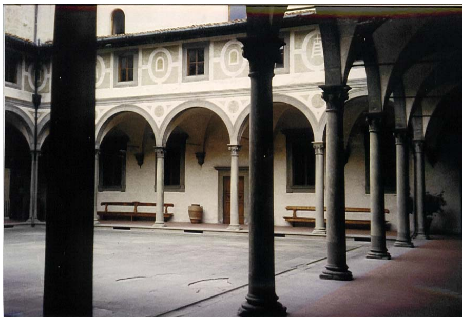
Fig. 1.32. Els patis de Brunelleschi són els primers que exemplifiquen aquesta precisió: els intercolumnis, les cantonades, les finestres superiors exactament centrades. Són un clar exponent de l'ordre i la precisió, tant en la seva concepció i projecte com en l'execució

El seu màxim luxe està en el temps, el pensament, la imatge, la cultura de qui ha pensat en la seva execució. És l'expressió del virtuosisme intel·lectual convertit en pedra, en gràcil columnata que sembla no notar el pes del que suporta, que alegra el passeig de qui té l'honor i la saviesa per moure-s'hi al pas adequat.