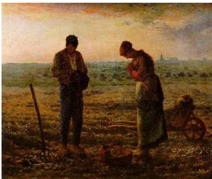
Fig. 1.31. A L'Àngelus, de Millet, la torre del fons presideix tota l'escena. Sembla que el so de la campana sigui corpori i fa evident que el poder de l'Església plana sobre els camperols.

Què hi ha més majestàtic i hermètic, imponent i inaccessible que un campanar medieval, la torre que plana sobre els nostres caps i ens marca el ritme de la vida i de la mort? Quan sona la campana, la vida s'atura un moment per interpretar-ne el missatge i se'n segueixen al peu de la lletra les indicacions, com si una veu divina s'estengués pels camps i boscos.