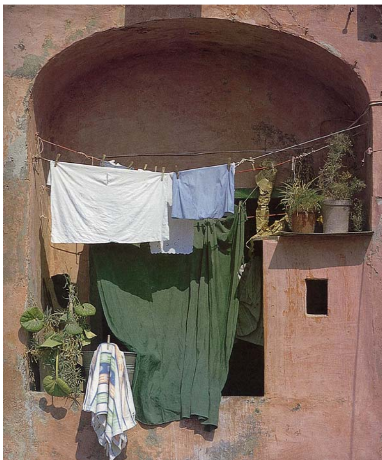
Fig. 1.27. Espai intermedi múltiple. Balcó a doble alçària, amb comuna i estenedor

Patis, terrats, porxos, balcons..., en un primer moment els imaginem en habitatges habitats . El primer que ens ve al cap són espais intermedis en situacions domèstiques; semblen els més immediats.