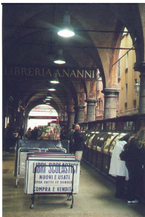
Fig. 1.33. Mercat a sota d'una estructura porticada

Si prenem el mercat com a element summament característic del paisatge urbà, que té l'origen en una activitat periòdica i reiterada al llarg del temps, veiem que des del moment que té una continuïtat suficient, necessita una construcció per establir-s'hi. La primera aproximació constructiva que soluciona aquesta necessitat són diversos tipus d'espais intermedis, molt sovint basats en estructures porticades, siguin aïllades o adossades a edificis existents.