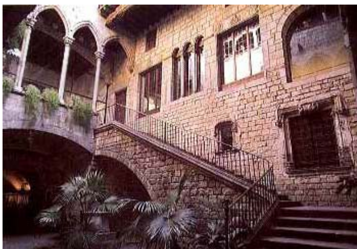
Fig. 1.25. Pati d'una casa medieval del carrer Montcada (Barcelona). Encara que es tracta d'un palau i no d'un habitatge d'artesà, la separació de les funcions entre les plantes inferiors i les superiors segueix evident

L'habitatge medieval urbà —i a partir d'aquí només es considerarà el que succeeix a Europa— encara combina la vida familiar i laboral en un mateix edifici, si bé hi ha diferenciacions entre parts més privades i més públiques. S'observa que aquesta separació es pot fer en alçària o en profunditat. En alçària, significa reservar la part alta de l'edifici per a la vida familiar i la part baixa, més relacionada amb el carrer, per a l'artesania i el comerç; en profunditat, significa seguir el mateix patró però a un sol nivell: la part més propera al carrer es dedica al comerç i la més allunyada, a la família. Aquesta distinció també es pot apreciar a l'habitatge urbà oriental, respecte al món dels homes i de les dones.