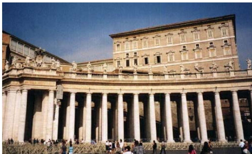
Fig. 1.36. La columnata de la plaça de Sant Pere (Ciutat del Vaticà), de Bernini, és una clara mostra del poder de l'Església

Però n'hi ha que són clarament el resultat d'una voluntat explícita dels governs de la ciutat del moment —ja fossin l'Església, el rei, etc. — i que presenten una escala decididament monumental.