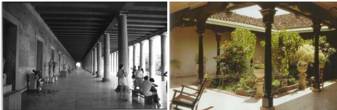
Fig. 3.62. Estoa de l'àgora d'Atenes. i pati. Exemples de comunicació lineal i puntual

passadissos entre cambres, sinó que una cambra porta a l'altra a través de pannels translúcids que deixen entreveure, però que mai no s'obren sense voluntat explícita. Des de la nostra cultura de l'estoa, l'àgora i el propileu , sembla difícil de creure la incomoditat que poden crear a persones d'altres cultures els nostres espais de pas.