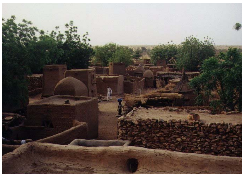
Fig 3.57. Espais intermedis en una arquitectura molt primitiva. Poble dogon, Mali

Ja es troben espais intermedis en l'arquitectura popular, la que no té projecte previ, que no s'acostuma a permetre vel·leïtats i estalvia tota mena de mitjans. És una arquitectura que amb els mínims mitjans aconsegueix les millors prestacions; és un sistema d'alt rendiment que amb el mínim cost material i humà vol obtenir els millors resultats.