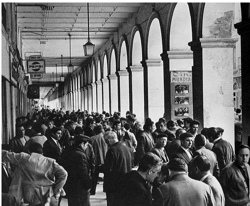
Fig. 3.66. Mercat de la Bisbal. Intercanvi comercial sota una porxada.

Un altre nivell de relació amb el món exterior són les relacions de negocis . L'intercanvi de béns materials o espirituals ha estat, i encara és, una de les activitats primordials de la humanitat. Aquests espais entre dins i fora, que poden ser íntims o públics, són i han estat escenari d'intercanvis i producció de béns per intercanviar. Fins al punt que un dels mots que defineixen un d'aquests espais intermedis, com és la llotja, és sinònim d'espai d'intercanvi; i no només de moneda i de valors, ja que no podem oblidar les nostres llotges de peix. Carrers porticats d'origen hel·lenístic es converteixen en basars orientals; vestíbuls de palaus medievals es converteixen en botigues o museus, i tants altres espais que són taller, botiga o negoci, en una relació primària amb el mateix habitatge. Cap al Renaixement es comença a separar, a les nostres cultures, l'habitatge del treball i això marca una tendència clara en l'ús d'aquests espais.