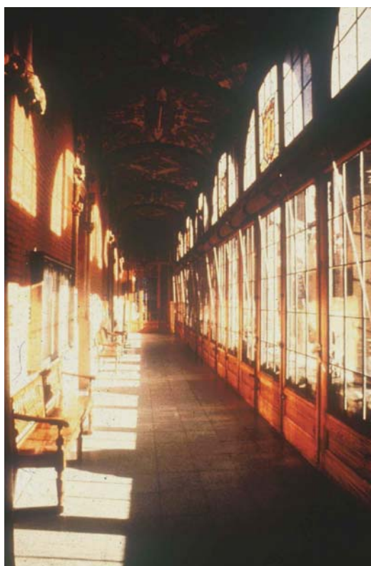
Fig. 3.64. Galeria de l'Hospital de Sant Pau. Sala d'espera, de visita; de passeig, de repòs.

Els espais d'estar d'ús discontinu també neixen per la seva capacitat d'adaptar-se a molts usos poc específics. El concepte d'ús discontinu porta associada la consideració que el temps que s'hi està és (o hauria de ser) relativament curt. Quantes sales d'espera d'hospitals trobem en generoses galeries vidrades projectades com a pas del personal hospitalari i passejada assossegada dels malalts!