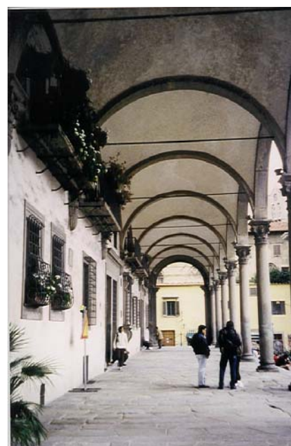
Fig. 3.63. Pòrtic de la plaça de l'Hospital dels Innocents, a Florència

No es poden deixar d'esmentar els espais intermedis que acompanyen la transició entre espai públic i privat: aquest desplaçament, en un moment o altre, es fa per algun espai intermedi. En aquest punt, caldria tractar de nou l'àmbit dels espais borrosos entre l'espai públic i el privat, és a dir els espais intermedis de la ciutat, tan importants a les nostres ciutats mediterrànies —com és el cas històric de l'àgora, els pòrtics urbans, etc. Tanmateix, tot i haver estat tractats de passada anteriorment, no es pretén aprofundir-hi. Aquest tema ja és per si mateix motiu per a un estudi molt més ampli, que si bé aquí es pot apuntar, queda per a altres treballs amb una visió més urbana del fenomen, alguns dels quals potser ja s'estan desenvolupant actualment.