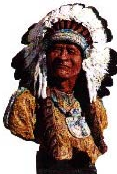
Fig 3.58. Les manifestacions externes dels individus de grups concrets, poden ser molt sorprenents per a altres cultures

Si bé en els climes extrems el vestit sembla imprescindible ateses les condicions climàtiques existents, en altres llocs, on podria considerar-se sobrer, respon més aviat al resultat d'una manifestació d'altres desitjos que a la necessitat de protecció pròpiament dita.