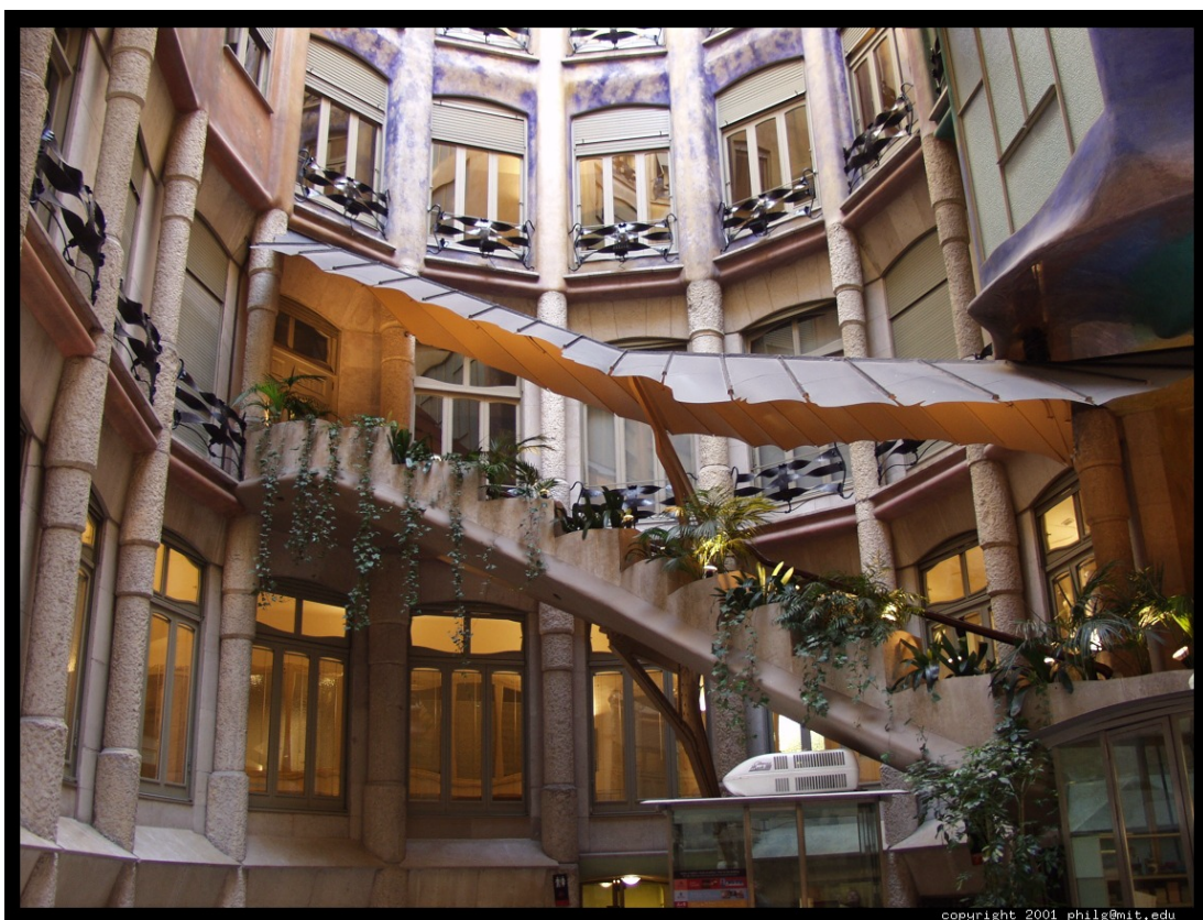
Fig. 3.60. A. Gaudí. Pati de la Pedrera, Barcelona. Comunicació VERTICAL