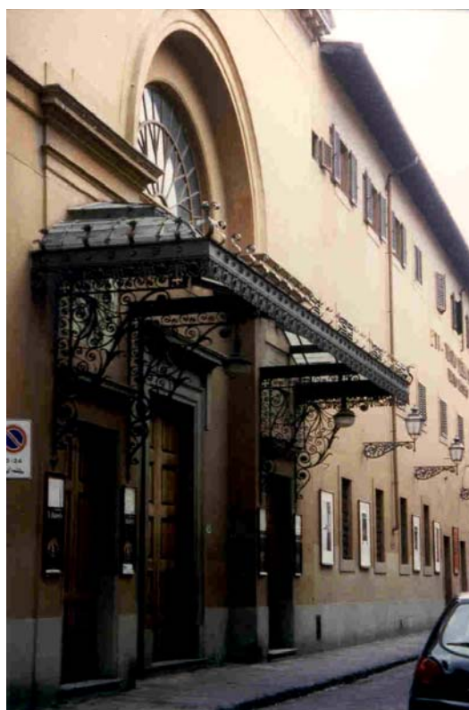
Fig. 3.65. Marquesina del teatre de la Pergola, Florència

També porta associada la idea "d'espai previ a un altre", on les condicions de vestimenta són diferents. En aquest punt trobem porxos i marquesines que serveixen per desempallegar-se i deixar-hi els esquís i les botes, de la mateixa manera com abans en els generosos vestíbuls hi havia prou espai per treure's capes i espases. (Un altre tema seria on es deixaven el cavalls i on els hem de deixar ara, però no ve al cas.) Proteccions per a les esperes curtes o per als comiats serien les marquesines, on s'espera un taxi o el tren, o es fa cua per comprar una entrada.