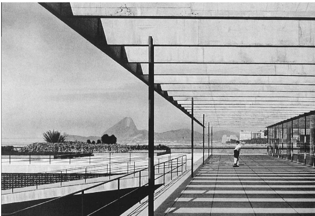
Fig. 3.59. Oscar Niemeyer. Comunicació HORIZONTAL