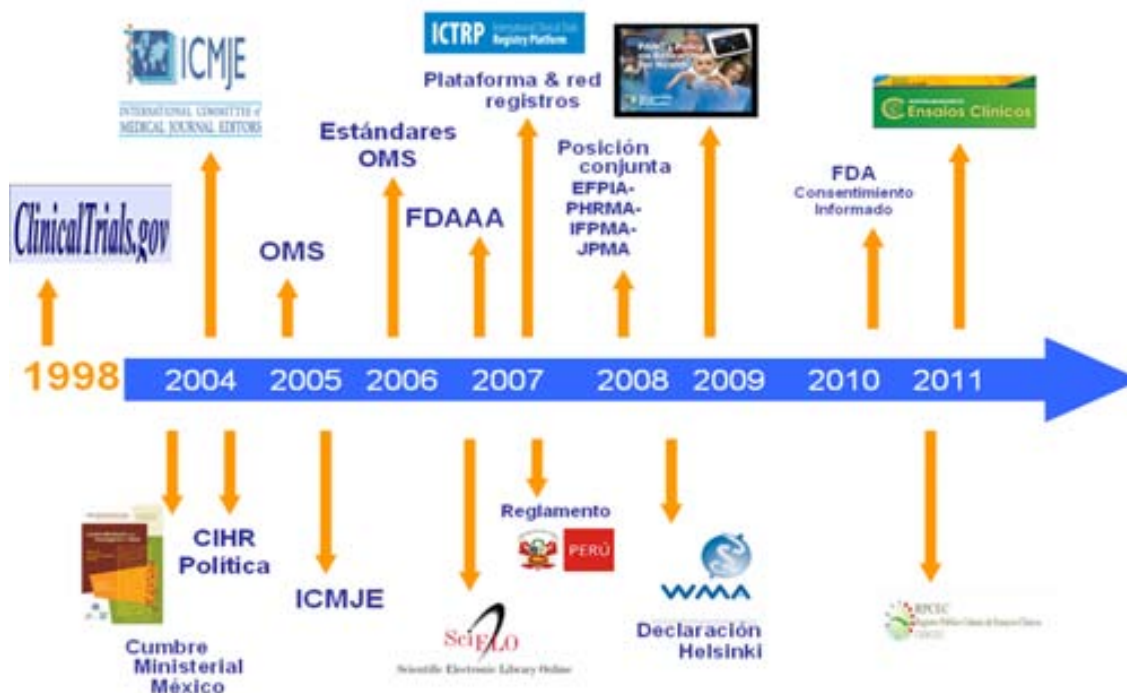
Figura 1. Antecedentes clave relacionados con la iniciativa de registro de ensayos clínicos