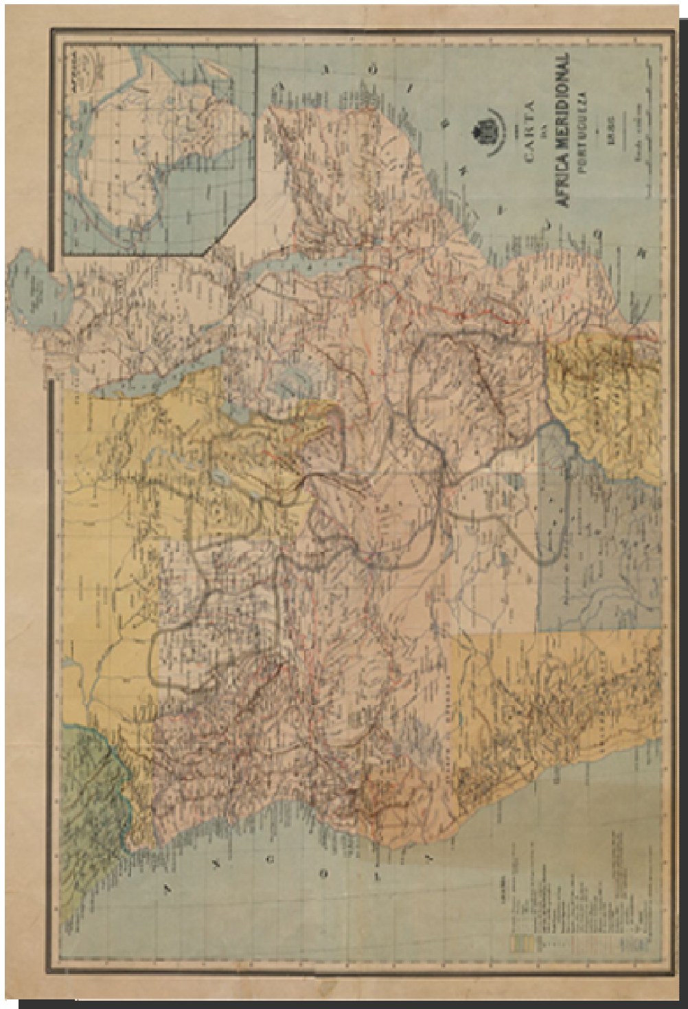
DOCUMENTO Nº 1 O mapa cor-de rosa