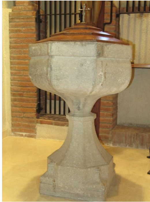
Parròquia de Sant Joan de Campins

Les parts de baix d'aquestes cares es van estrenyent fins el començament del peu de sustentació del que les separa un voraviu octogonal. La base d'aquest peu és quadrada, de la que pugen vuit cares fins el voraviu esmentat. La tapa és de fusta de tres parts rematada amb una creu. Hi ha senyals que antigament hi havia una tapa fixa.