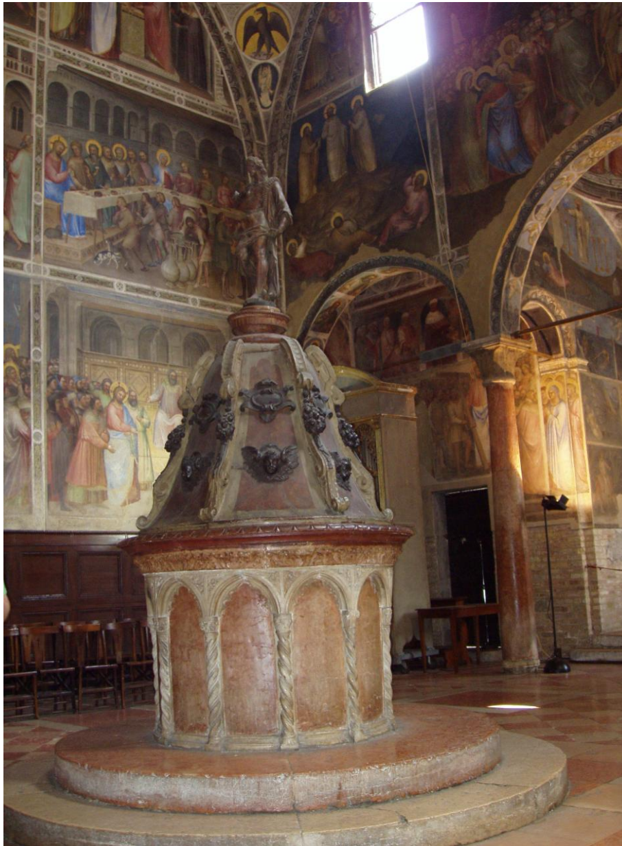
Saint Etienne. Catedral de Auxerre (Borgonya. França)

sepulcral. L'any 1405, però, el Baptisteri torna a tenir la seva funció original. En el centre d'aquest Baptisteri s'hi va col·locar l'any 1443 la pila baptismal de Giovanni da Firenze. Com que la decoració era per a capella funerària, el tema dominant és la història de la salvació. És un exemple característic de la grandària que es volia donar, a l'època, al lloc de la celebració del baptisme. La pila baptismal, de marbre, amb unes arcades a tot el voltant, i una tapa amb uns àngels, rematada amb la figura de Joan Baptista batejant a Jesús.