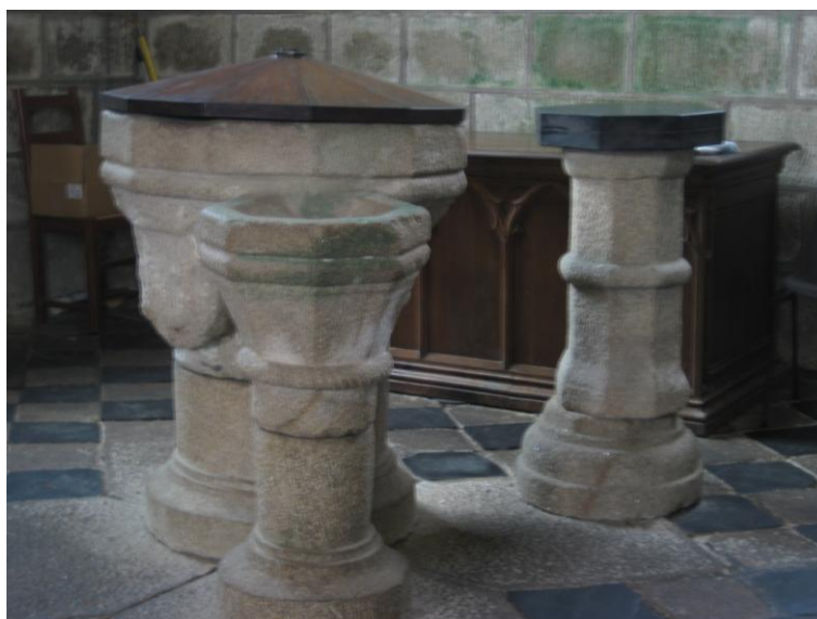
Saint Nikolas. Catedral de Fribourg. Suïssa

En aquesta església hi trobem una pila baptismal on al costat de la pila per a contenir-hi l'aigua de batejar, hi ha dues piles més petites que tenen la funció, una d'elles, per a dipositar-hi el que és necessari per al bateig, i l'altra que serveix per recollir l'aigua que cau del cap del nou batejat. És una església medieval d'un poblet amb les característiques pròpies d'aquella època. No n'hi ha de semblants a la Província Eclesiàstica de Barcelona.