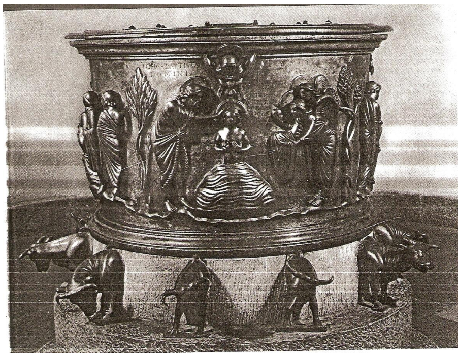
111. Reiner van Huy: pila baptismal de latón de San Bartolomé de Lieja. Entre 1107 y 1118.