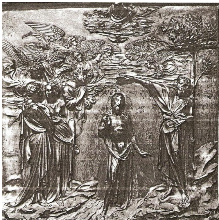
152. Ghiberti, El bautismo de Cristo. Relieve en bronce dorado, de una pila bautismal. Acabado en 1427. Siena, San Giovanni.

Lorenzo Ghiberti (1378/1455), florentí de la generació de Donatello, va fer uns relleus per a la mateixa pila de Siena per a la que Donatello va fer la seva “Dansa de Salomé”. A l’obra de Donatello podem dir que tot era nou. A la de Ghiberti sembla tot molt menys sorprenent a primera vista.