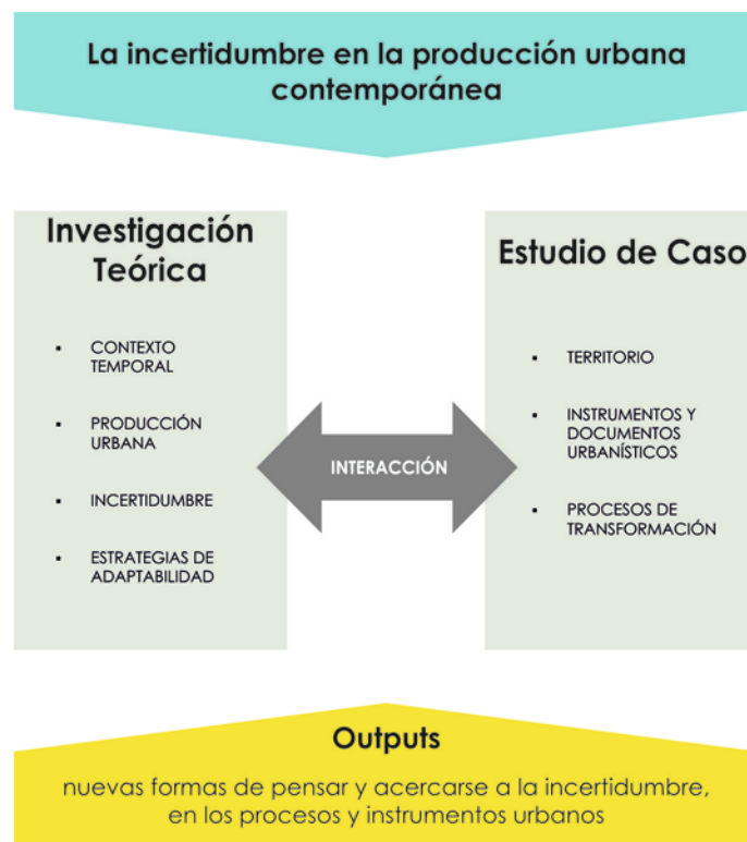
Fig. 1 | Esquema de desarrollo metodológico de la tesis.