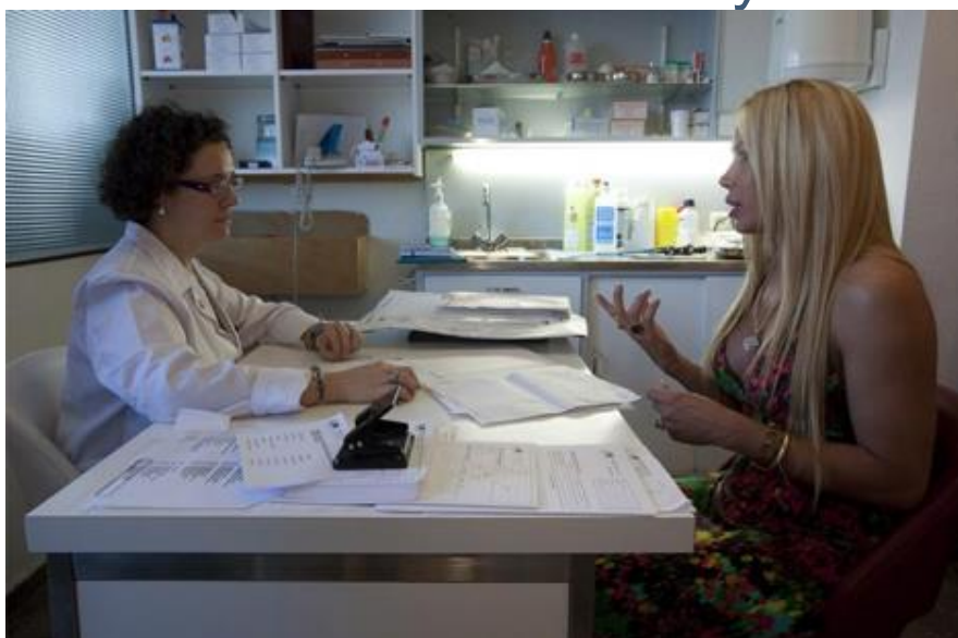
Una paciente se somete a una consulta previa a la operación.