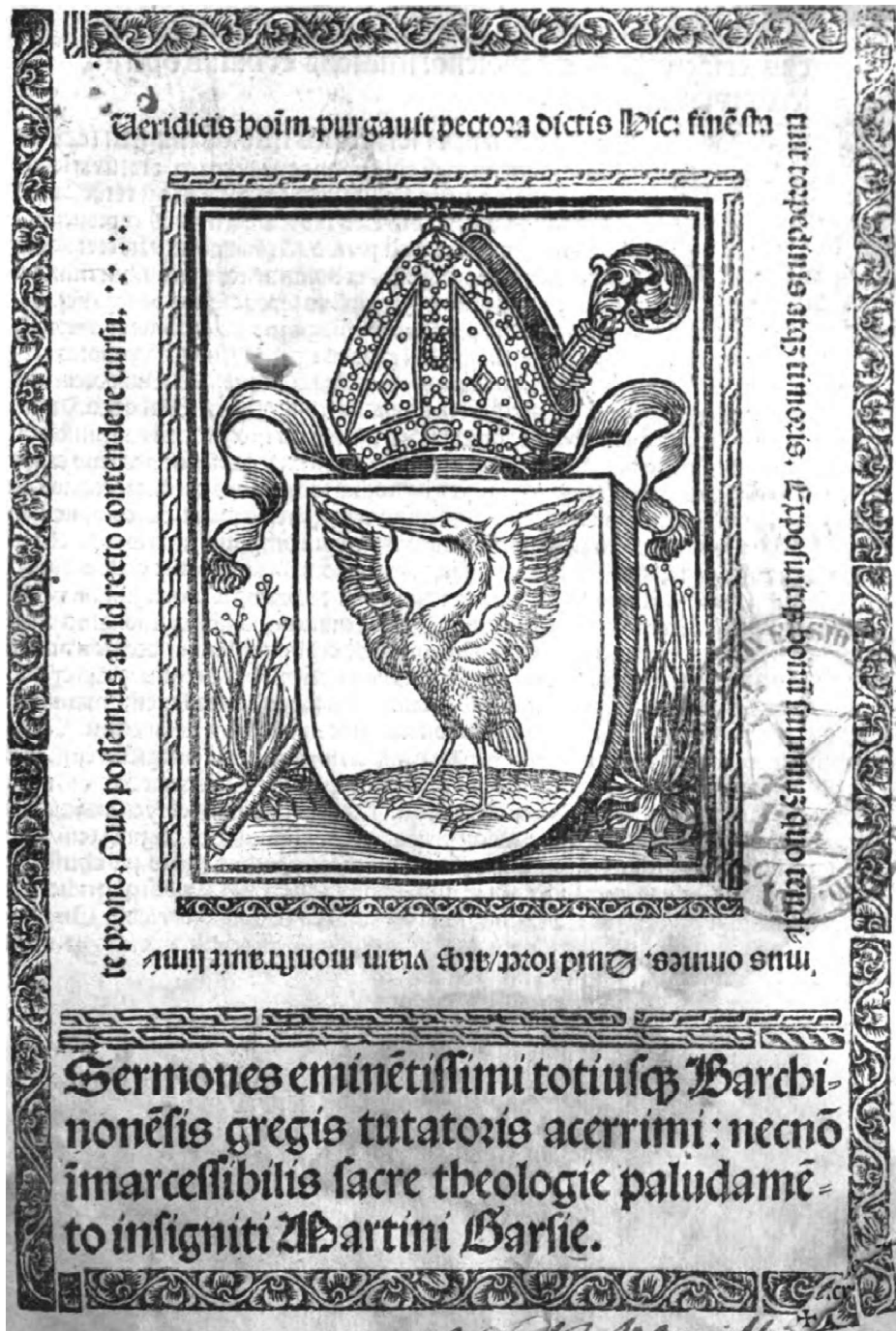
Imagen superior: portada de la editio princeps , impresa en Zaragoza el 17 de marzo del año 1520, donde se aprecia la mitra episcopal sobre una garza, atributos del obispo Martín García.

Transcripción del texto en portada: Veridicis hominum purgavit pectora dictis hic: finem statuit torpedinis atque timoris. Exposuitque bonum summum quo tendimus omnes. Quid foret atque uiam monstrauit limite prono. Quo possemus id ad recto contendere cursu.