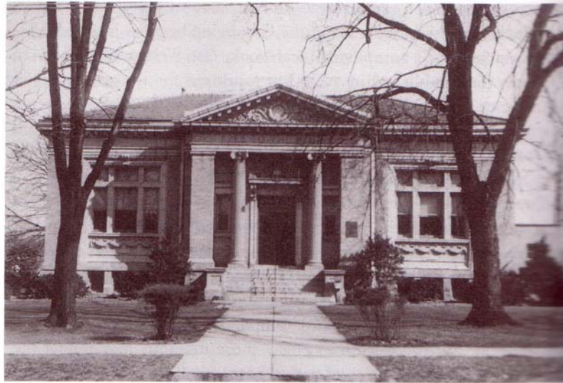
Figure 6.1 Carnegie Library, Xenia, Ohio, 1907. Courtesy of Greene County Room, Greene County Public Library, Xenia, Ohio

Fig. 2. Façana de la biblioteca Carnegie de Xenia (Ohio). Font: Van Slyck, Free to all... , p. 204.